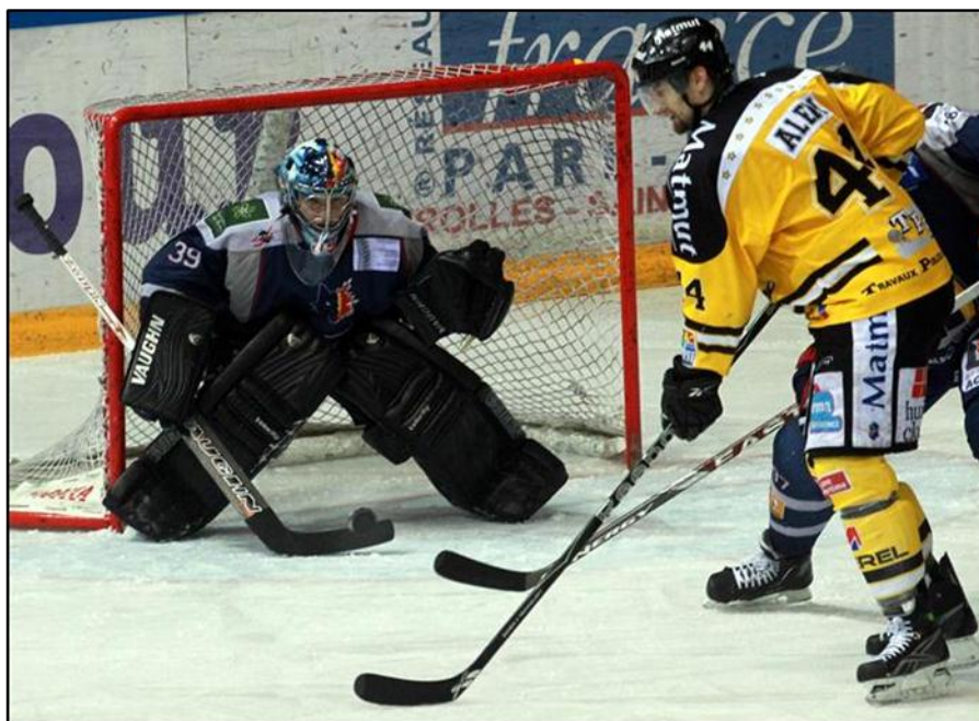
Pieds parallèles lorsqu'un attaquant est en possession de la rondelle.